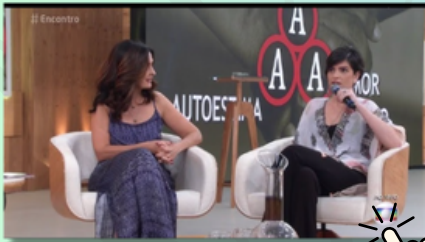
ENTREVISTA PARA FÁTIMA BERNARDES TV GLOBO