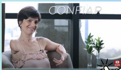
ENTREVISTA AO PROJETO ESTRELAR