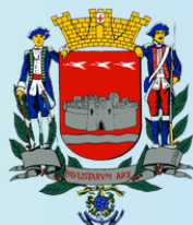
GUARATINGUETÁ - SP