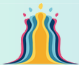
Grupo Mulheres do Brasil